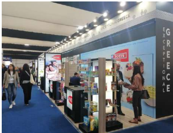
PLMA AMSTERDAM 2019