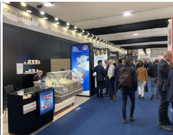
PLMA AMSTERDAM 2019